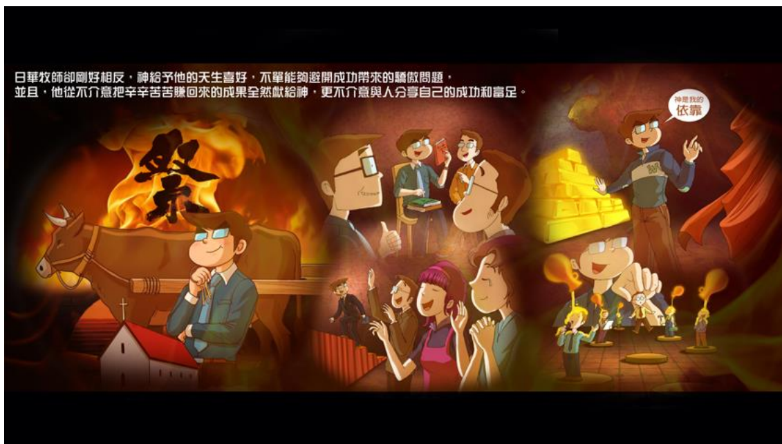
日華牧師卻剛好相反，神給予他的天生喜好，不單能夠避開成功帶來的驕傲問題，並且，他從不介意把辛辛苦苦賺回來的成果全然獻給神，更不介意與人分享自己的成功和富足。

就如亞伯拉罕，能夠義無反顧、毫無保留地，將自己一百歲因神蹟而誕生，最深愛的兒子以撒獻給神，沒有一絲拖延和不捨得，